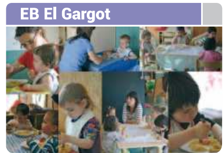
EB El Gargot