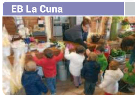
EB La Cuna