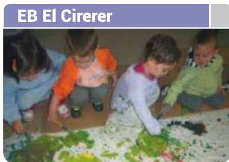
EB El Cirerer

La presentació de les sol·licituds per a la preinscripció a les escoles bressol municipals és del 6 al 17 de maig demanant cita prèvia a l'Oficina d'Atenció Ciutadana, al telèfon 93 573 88 88. El període de matriculació dels admesos es farà a cada centre del 10 al 14 de juny. L'oferta total d'enguany és de 145 places, 21 per als infants nascuts entre l'1/10/2011 i el 13/05/2012; de 50 per als nascuts de l'1/01/2011 al 30/09/2011 i de 74 places per als nascuts entre gener i desembre de 2010.